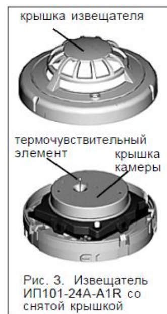
Рис. 3. Извещатель ИП101-24А-А1R со снятой крышкой